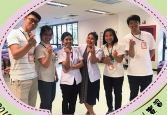
2018年本系學生赴泰國馬希賓大學海外研習