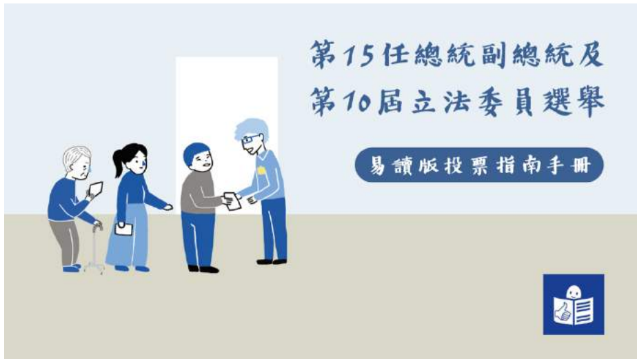
總統與副總統+立法委員選舉投票動線圖

這本手冊主要是提供給智能障礙者、文字閱讀能力有困難的人所使用的易讀版投票說明手冊,說明民國 109 年 1 月 11 日第 15 任總統副總統及第 10 屆立法委員選舉的投票流程,以及相關的重要資訊。