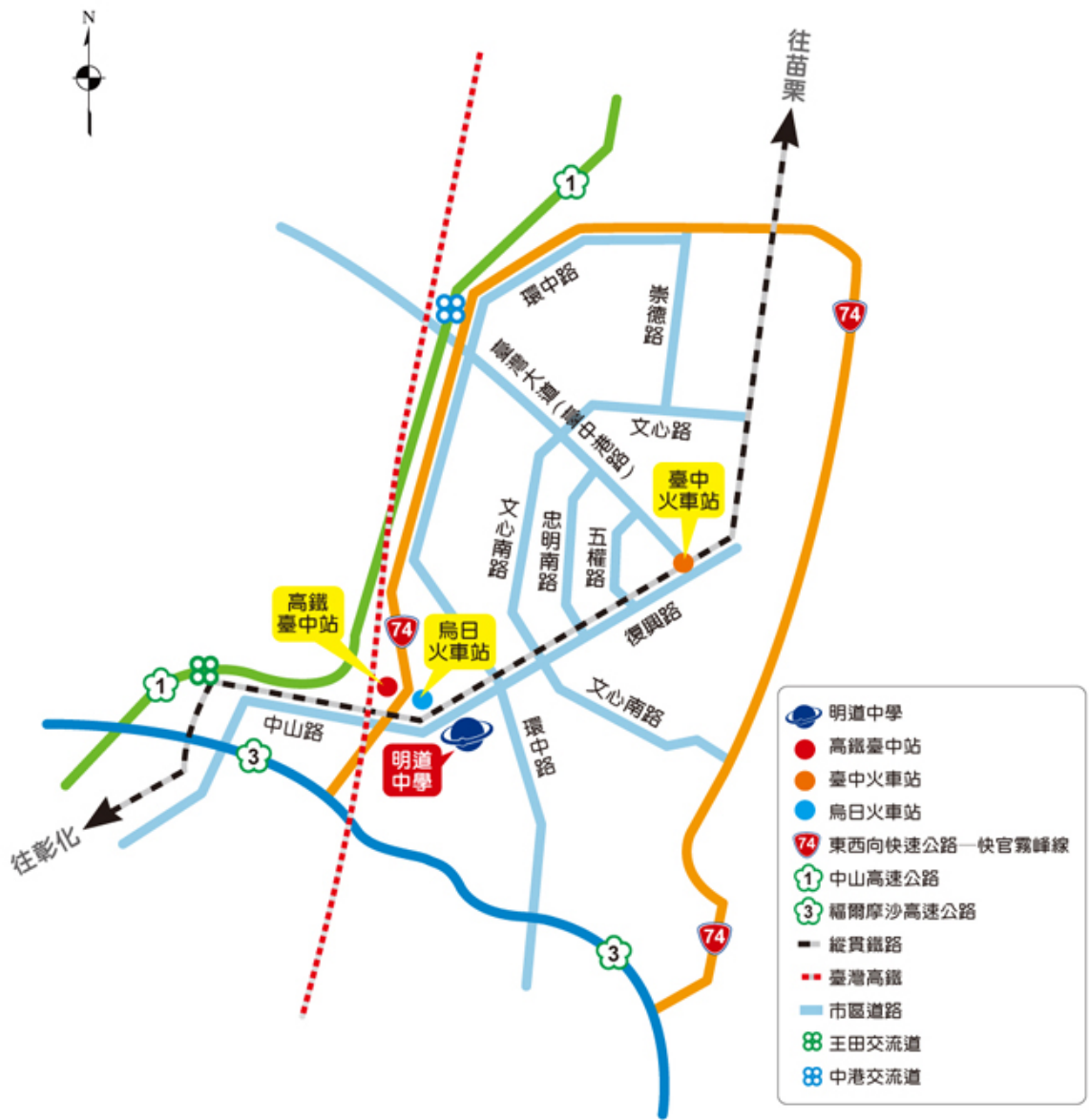
圖 3 明道中學地理位置圖