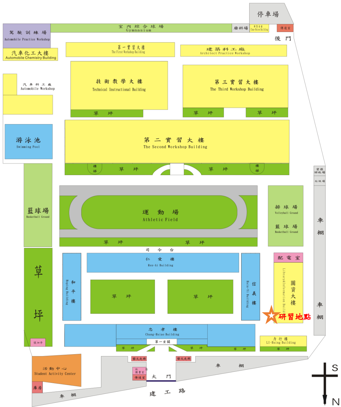
圖 2 研習場地平面圖