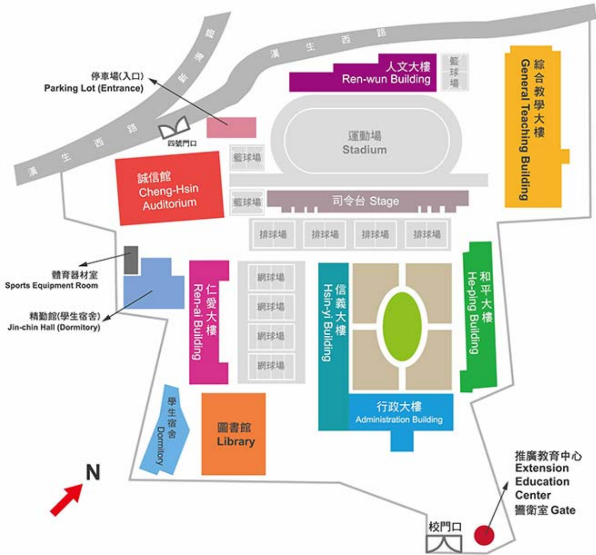
圖 5 致理科技大學研習場地平面圖