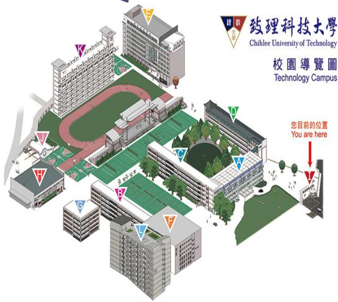
圖 1 校園導覽圖