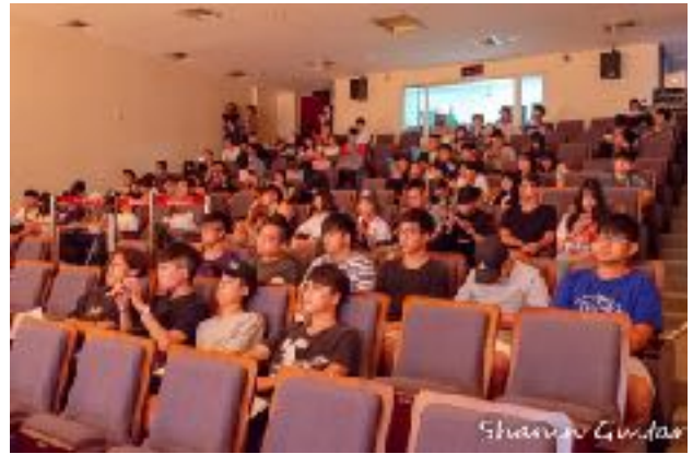
圖2 青永館6F采風堂圖（二）