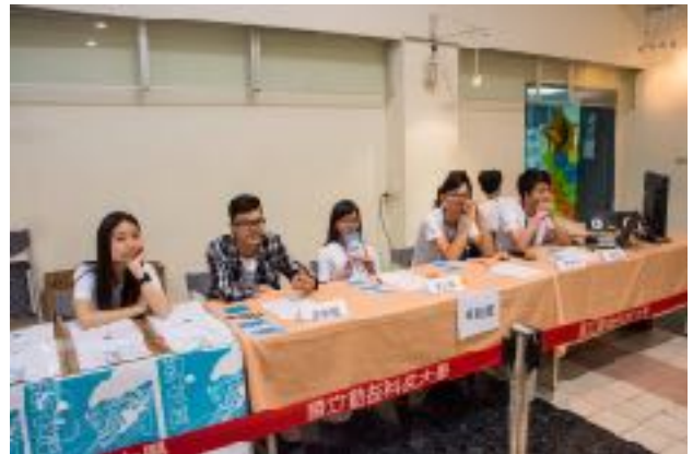
圖4 青永館6F靜軒廳圖（二）