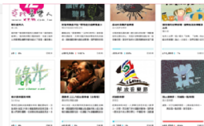
圖8 flying v群眾募資平台示意圖（二）