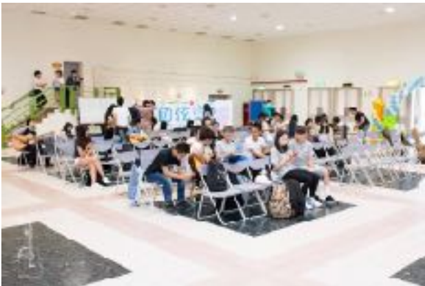
圖3 青永館6F靜軒廳圖（一）