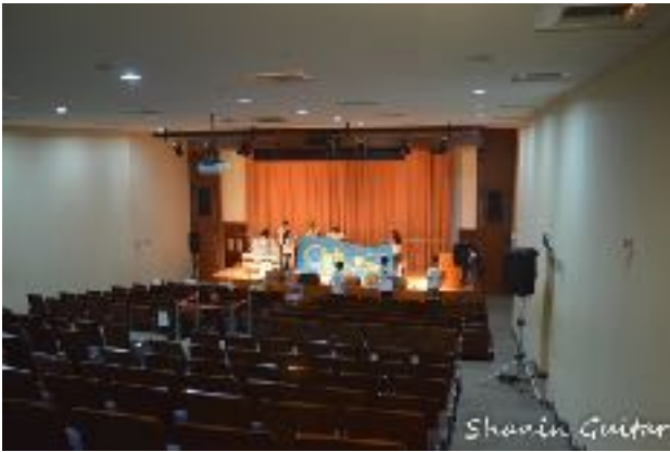
圖1 青永館6F采風堂圖（一）