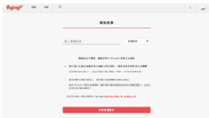
圖7 flying v群眾募資平台示意圖（一）